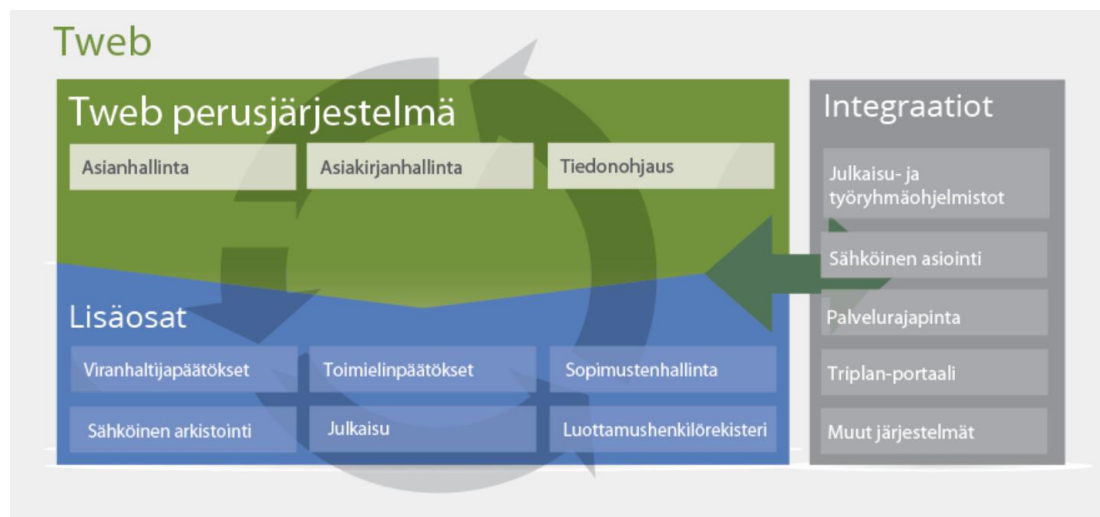
Kuva: TwebKIURU asioiden ja asiakirjojen -hallintajärjestelmä ja tiedonohjaus, viranhaltijapäätökset, toimielinpäätökset, julkaisu sekä sähköinen arkistointi

Kiuruveden kaupungilla on ollut vuonna 2019 käytössä KuntaToimisto -asianhallintajärjestelmä diaarin, asianhallinnan, kokousjärjestelmän, viranhaltijapäätösten ja julkaisun osalta. KuntaToimisto-ohjelmisto on nyt päivitetty uuteen TwebKIURU asioiden ja asiakirjojen -hallintajärjestelmään, koska tietosuojasääntely edellyttää julkisen tiedon tuottamiselta ja hallinnalta entistä tarkempaa huolellisuutta tietojen julkaisemisessa sekä salassa pidettävien tietojen suojaamisessa. Uusi selainpohjainen versio mahdollistaa myös sähköisen arkistoinnin tulevaisuudessa. Järjestelmä on toiminnallisuuksiltaan julkishallintoa ohjaavan SÄHKE2-määrityksen mukainen, joka mahdollistaa sähköisen materiaalin keskitetyn hallinnoinnin ja hävittämisen. Uusi ohjelmisto otetaan käyttöön asteittain 1.1.2020 alkaen.