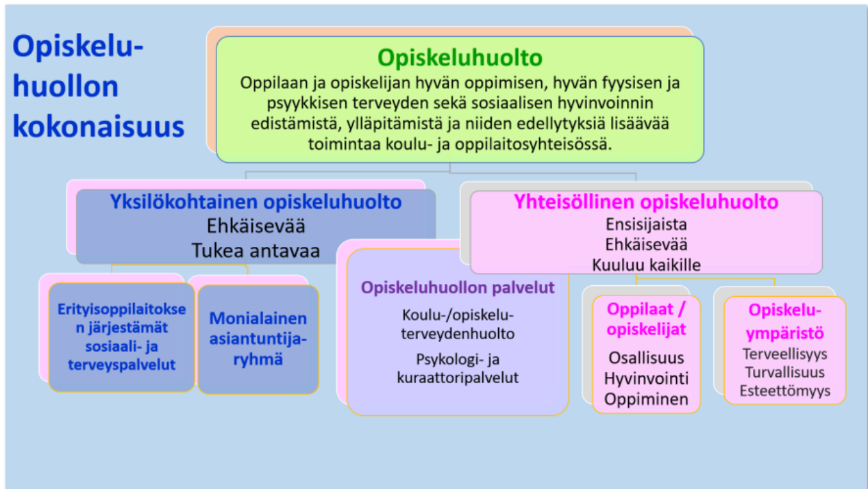
(Kuva: OPH- Opiskeluhoollon kokonaisuus)