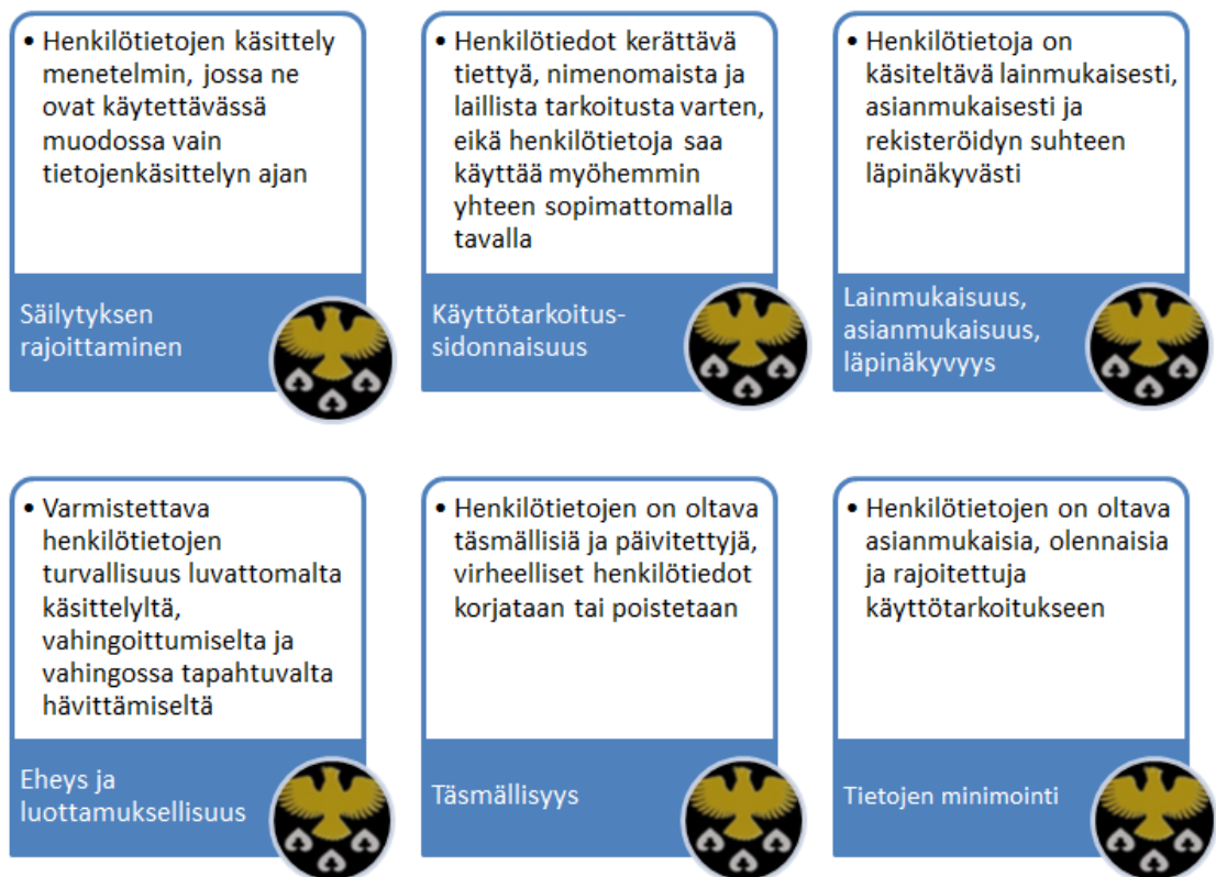
Kuva: Henkilötietojen käsittely Kiuruveden kaupungissa

Henkilötietojen käsittelyssä Kiuruveden kaupunki tulee noudattamaan hyvää tiedonhallintatapaa ja kehittää toimintatapojaan siten, että ne vastaavat EU:n yleisessä tietosuoja-asetuksessa annettuja vaatimuksia. Tietotilinpäätöksessään vuosittain kaupunki arvioi ja osoittaa jatkossakin noudattavansa alla kuvattuja periaatteita.